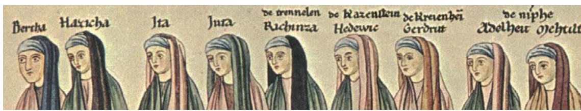
Hortus deliciarum (fol. 323r)