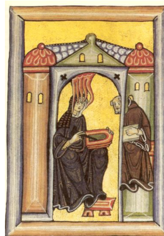
Hildegarda de Bingen i Wolmar en la primera il·lustració de l'edició facsímil del Scivias .

Des del present observem que un fil d'unió de moltes autores d'aquest període és la passió per la llibertat i la saviesa.