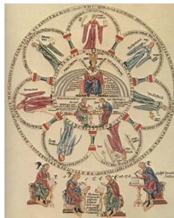
Il·lustració de les Arts Liberals i de la Saviesa (al centre) de l' Hortus deliciarum (fol. 32r) d'Herrada de Hohenbourg

Es tracta d'un terreny sembrat de dificultats i d'interrogants, però també un aspecte molt enriquidor en l'estudi de les autores medievals i d'altres èpoques.